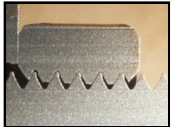
Dual-Angle™ のねじ山形状 によるバネ作用

ナットの材質の伸縮復元力を利用したロック効果により、振動による緩みを防止するとともに、締め付け時の摩擦を軽減します。